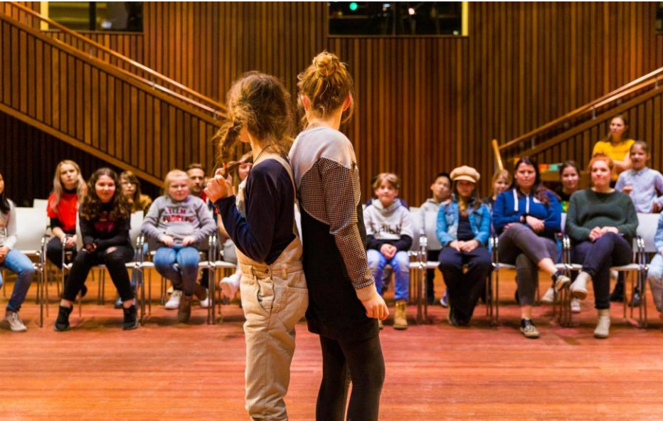
WOW locatie Parktheater Eindhoven