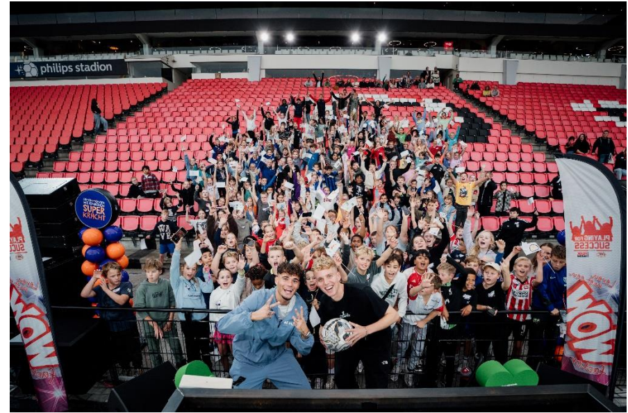
Spelenderwijs werken aan doelen tijdens de Superkrachtdag